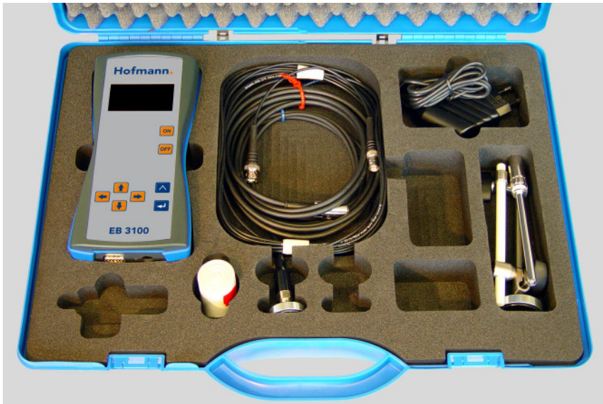
Pantalla EB 3100